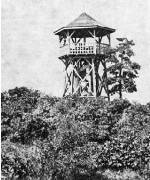
Kecse-hegyi kilátó (1905-1938)