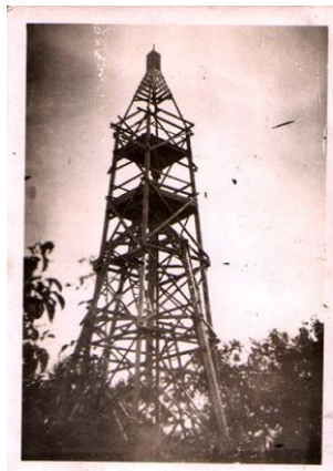
Pintytető háromszögelési alappont

A 261 méter tengerszint feletti magasságban található Pinty-tetőn régen fa építmény jelezte a magassági pontot, ami egyben kilátó funkciót is ellátott. 1979-ben állami földmérést szolgáló geofizikai mérőtorony épült vasbetonból.