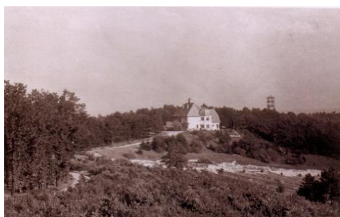
Hubertusz vadászlak a kilátóval (1880)

A mai Hubertusz-kilátó a harmadik ilyen jellegű építmény a soproni Dudlesz-erdőben. Az első kilátót az 1903-ban alakult Dunántúli Turista Egylet kezdeményezésére építették 1904-ben, a Bécsi-dombi víztárolótól nem messze, 264 m magasságban, amelyet 1926-ban sajnos lebontottak. 1930-ban egy vadászlakot és egy új kilátót építettek a helyére, de az 1938-as földrengéskor összedőlt és a II. világháború az épületeket is végérvényesen eltüntette. 1939-ben a Városszépítő Egyesület új kilátót terveztetett.