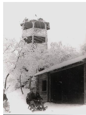
Szánkópálya indítóháza (1930)