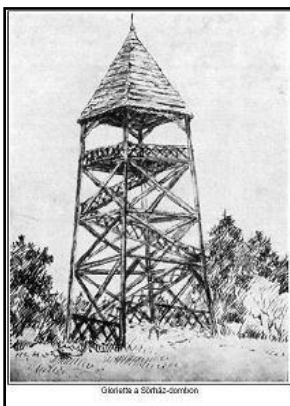
Gloriette a Sörházdombon (1900)

A Lőverek talán "legalacsonyabb" dombja a Sörházdomb (volt Tulipánmagaslat), mely a Soproni-hegység 300 m magas vonulata. A 298 méter magasán álló kilátó helyén először az 1900-ban épített gloriette állt. A fák megnöttek, a kilátót 3–4 m-rel megemelték, de ez sem használt, mert a fák gyorsabban nőttek, mint a kilátó. A háborús idők alatt a kilátó összedőlt. 1939-ben háromszögletű pontot jelöltek ki, melynek tornyát a turisták kilátóként használták. A II. világháború után a tornyot lebontották, helyén 1968-ban épült kilátó Rosenstingl Antal tervei szerint. A kilátót 2006-ban építette újjá ragasztott és csavarozott