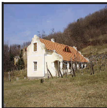
Préház, a hegy oldalában