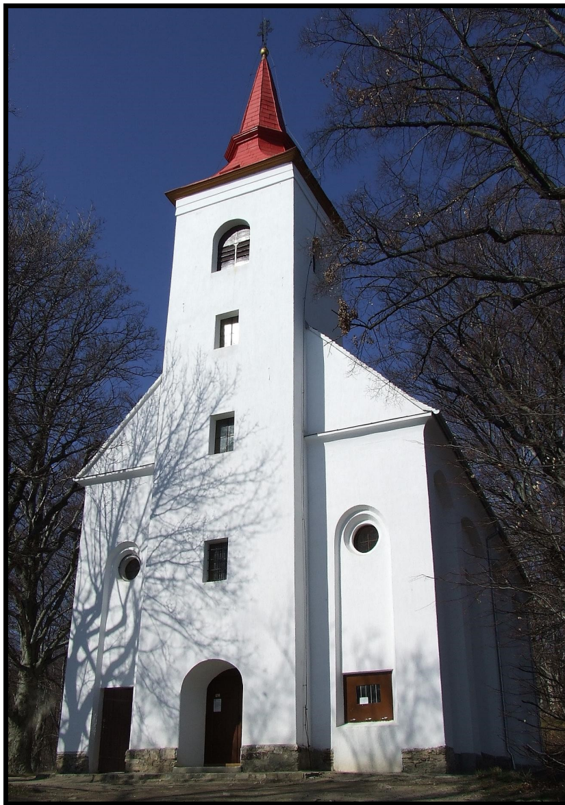
Szent Vid-hegyi kápolna

Szent Vid várát is Ottokár cseh királynak adta át. IV. László király 1273. július 6-án kelt oklevelében a Ják nemzetségből származó Chepánnak, az Ottokárnak átadott várak, köztük "castrum sua de Scentwyd" visszafoglalását tanúsított vitézségéért bizonyos falvakat adományozott. Németújvári Miklós birtoka 1279-ben, majd fia Iván örökölte, kitől 1289-ben Albert osztrák herceg foglalta el. Az 1291-ben kötött hainburgi béke alapján Albert a várat visszaadta azzal a kikötéssel, hogy azt le kell rombolni. III. Endre király a székesfehérvári országgyűlésen rendelte el, más várakkal együtt Szent Vid várának lerombolását, melyet feltehetően 1296-ban hajtottak végre. Ennek ellenére 1532-ben Jurusics Miklós a Szent Vid kapitánya nevet is viselte, de ekkor minden bizonnyal a vár romokban hevert. A helység 1374-ben "poss. Welyen", 1405-ben "Welyen", 1478-ben "Welem" néven, Rohonc vár tartozékeként szerepel. A XVIII. század elején Hilarian vár tartozékeként szerepel. Batthyány Lajos nádor segítségével a még fennálló keleti sarokbástya oldalán remetelakot és kápolnát épített. A vár megmaradt köveit a lakosság hordta szét építkezéseihez, és ma már csak nyomaiban található meg a Várhegyen.