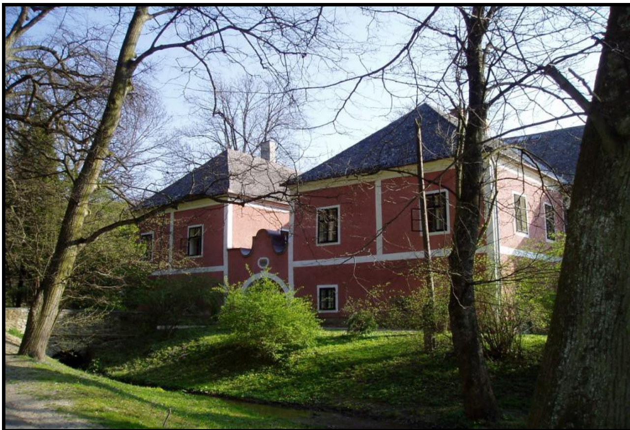
Bozsok Sibrik kastély