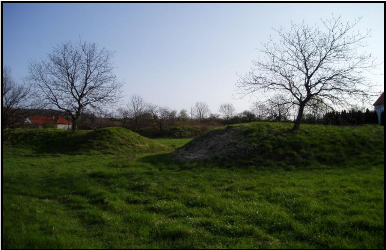
Bozsok Puszta