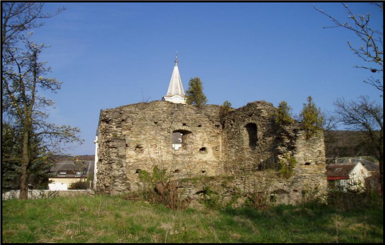
Bozsok várának romjai