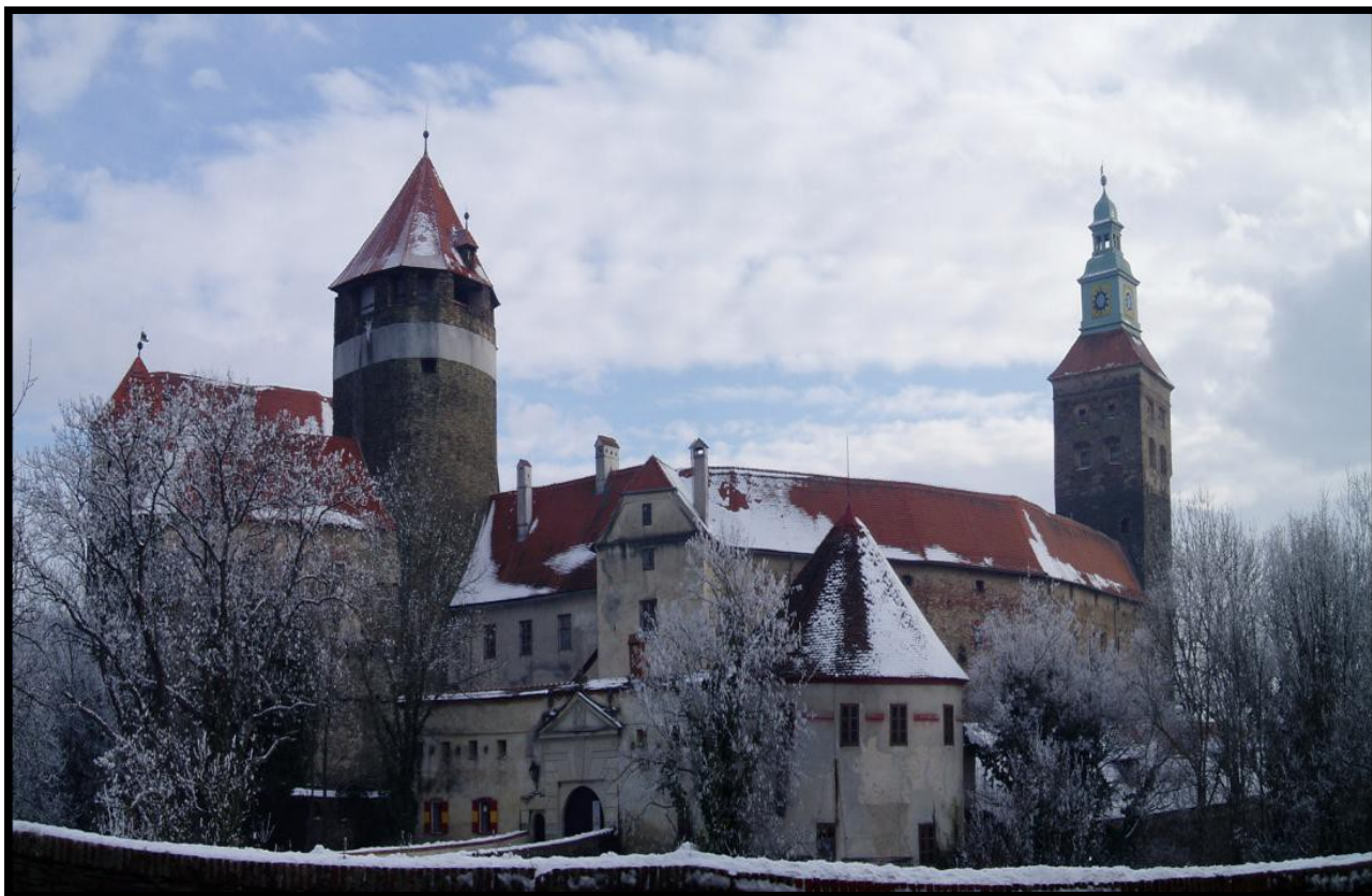
Szalónak lovagvára