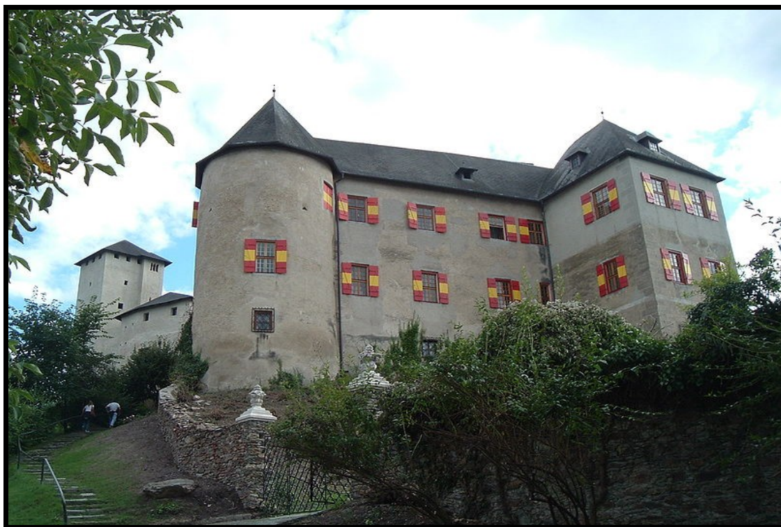
Léka vára

A település látnivalója még az 1719-ben felállított Immaculata (Pestis)-oszlop, a Természetrajzi Múzeum és a Kálváriahegy, ahol az 1678 körül épült Mária-kápolna és a Kálvária templom található.