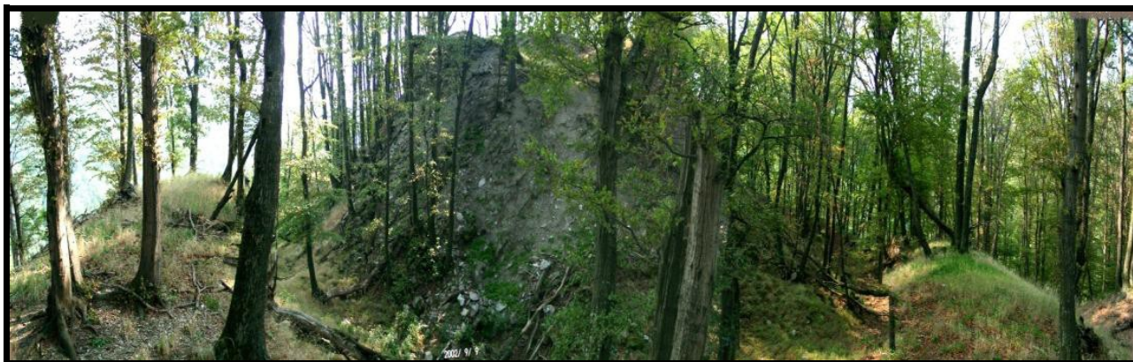
Rohonc várának romjai