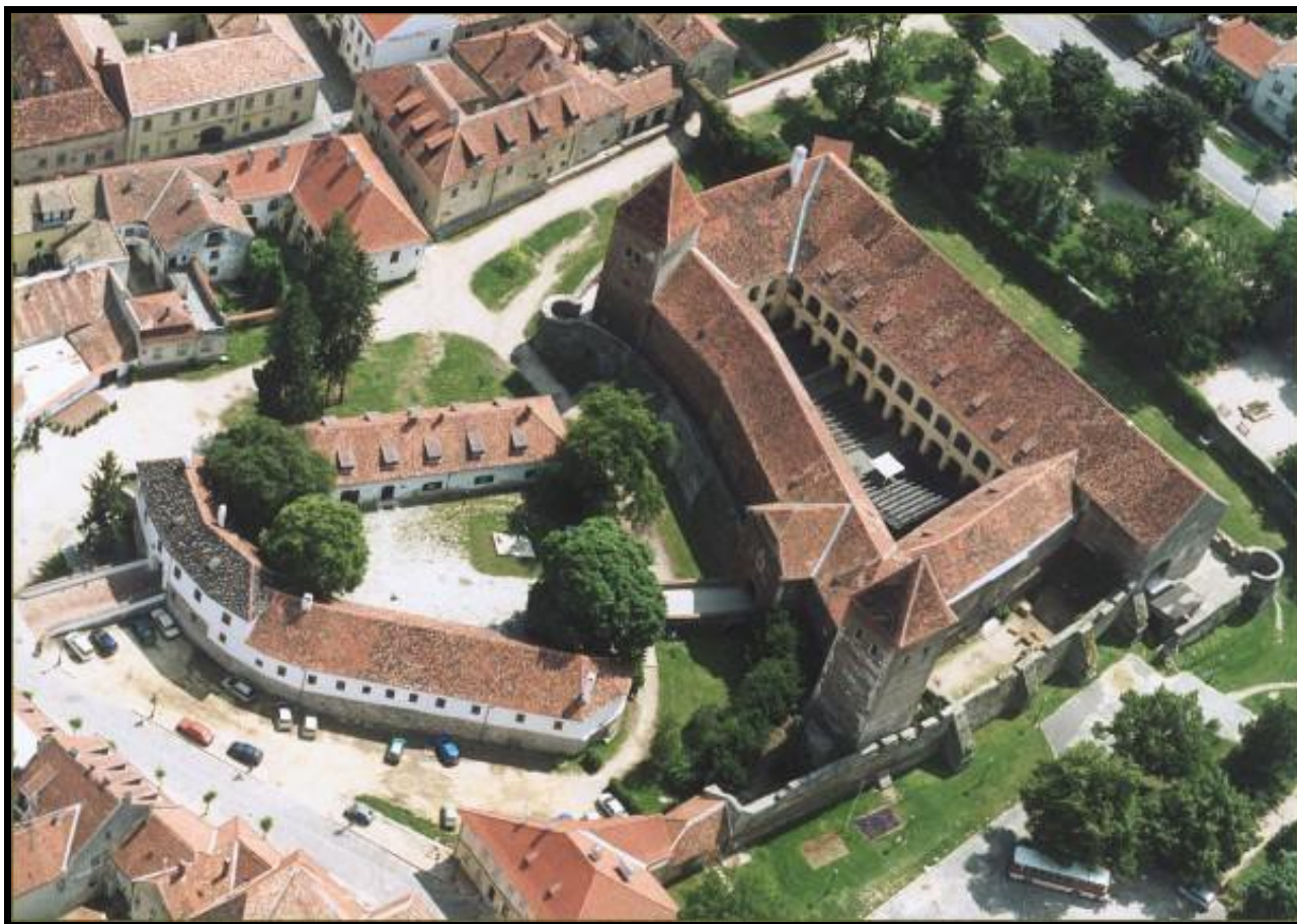
Kőszegi vár légi felvételen