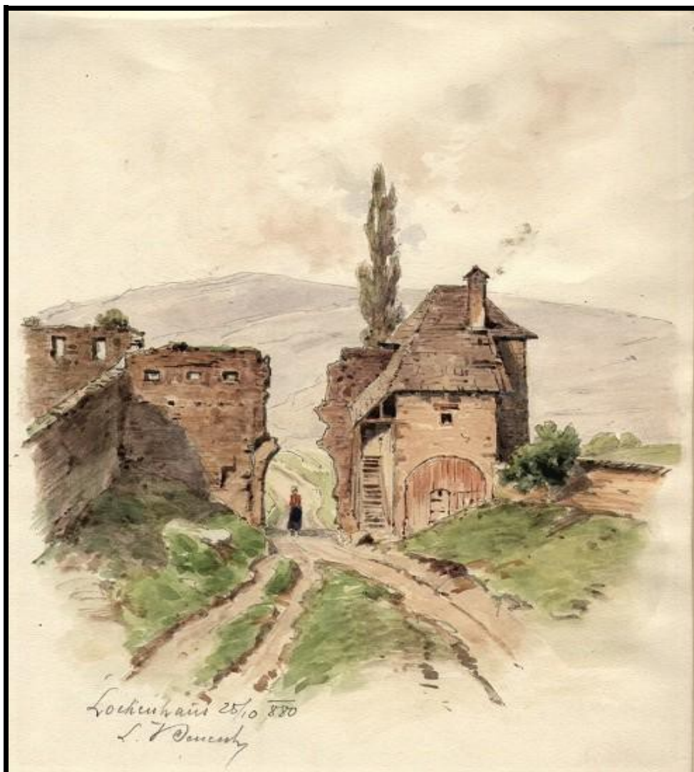
Lékai vár régi festményen