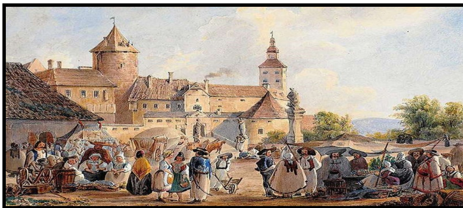
Szalónak régi festményen