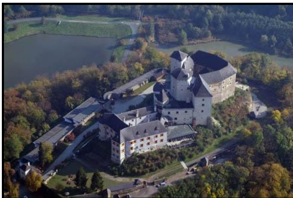
Lékai vár légi felvételen