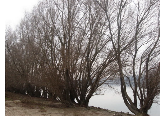
A Duna sálja-széltepett entek!