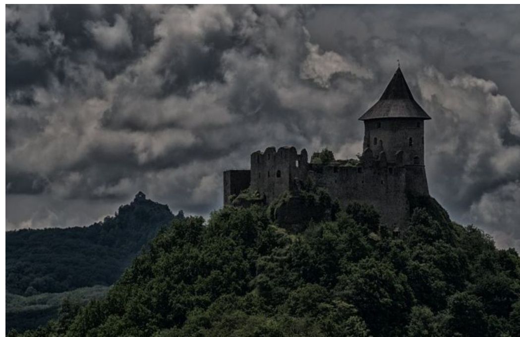
A fotókat az internetről töltöttem fel.