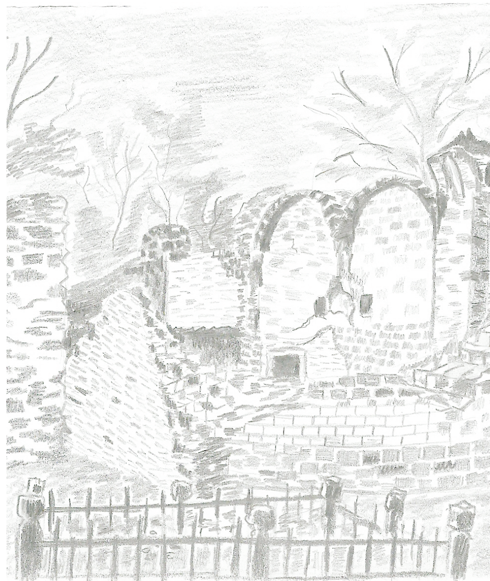
Balatonlelle Erdők Népe Természetjáró Egyesület