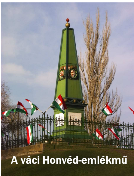
A váci Honvéd- emlékmű

A győztes isaszegi csata után a magyar hadvezetés válaszút előtt állt: vagy szemből támad a fővárosba és környékére összevont császári hadakra, vagy ismét megpróbálja bekeríteni azt. Az új haditervet Görgey Artúr április 7-én dolgozta ki. Ennek lényege egy átkarolási hadművelet, észak felől, Vácra, Léván át Komárom irányába. A főerők célja Komárom felmentése és ezzel a Pest-Budára összpontosított császári hadak bekerítése. Közben a pesti seregeknek elterelő támadásokat kell indítaniuk azt a látszatot keltve, hogy Görgey valódi célja Pest bevétele. Április 10-én újultak ki a harcok, amikor Windischgrätz feldeítőcsapatokat küld a Pest előtti erők számának meghatározására, azonban ezek nem járnak sikerrel. Szintén 10-én érik el a magyar csapatok Vácot. Damjanich arcból támad, míg Klapka az I. hadtesttel bekerítéssel próbálkozik. A harcban a várost védő erők parancs-noka, az utóvédet személyesen vezető Christian Götz vezérőrnagy meghal.